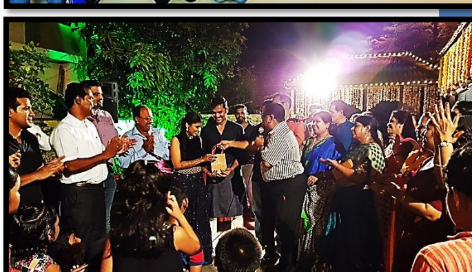
Dinner party for the Beachsiders at Balaji's Residence